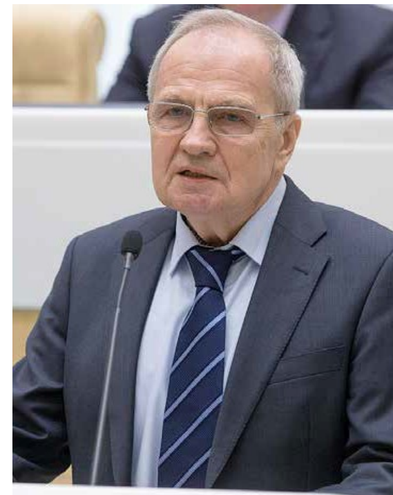
Зорькин В.Д. (1943 г. р.) Председатель Конституционного Суда РФ

Зорькин В.Д. Судебная власть перед вызовами времени (29.11.2022)