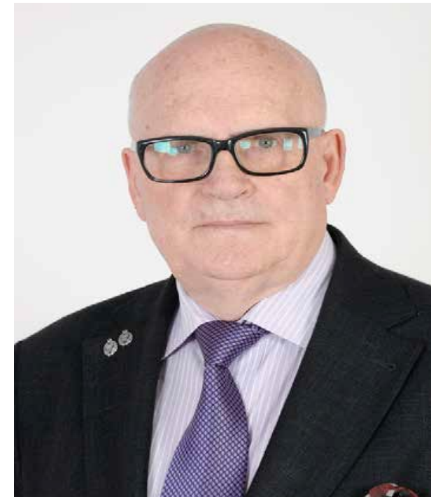
Николай Васильевич Витрук (1937-2012) Судья Конституционного Суда РФ, и.о. председателя (1993-1995)

Витрук Н. В. Юридическая природа конституционных прав и свобод (1980)