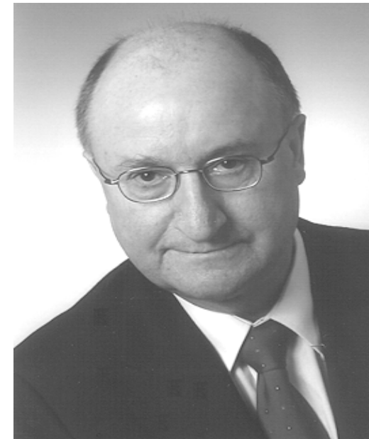
Роберт Алекси (1945 г. р.) философ права, профессор Кильского университета (ФРГ)

Alexy R. Die Institutionalisierung der Menschenrechte im demokratischen Verfassungsstaat (1998)